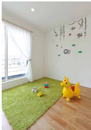
卵の殻を原料にした機能壁紙「エッグウォール」を採用しています。住む人に優しい自然素材を使っているので小さな子供でも安心です