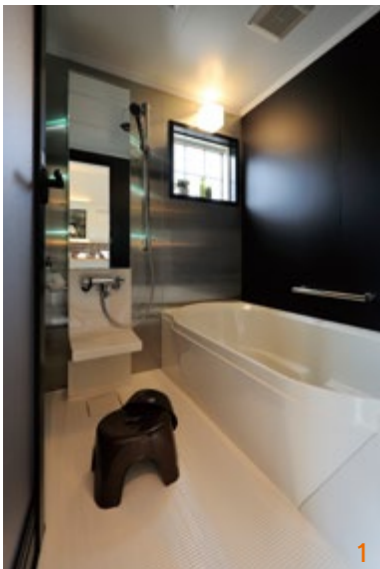
1. ブラック&ホワイトでモダンに演出されたバスルームは高級感たっぷり