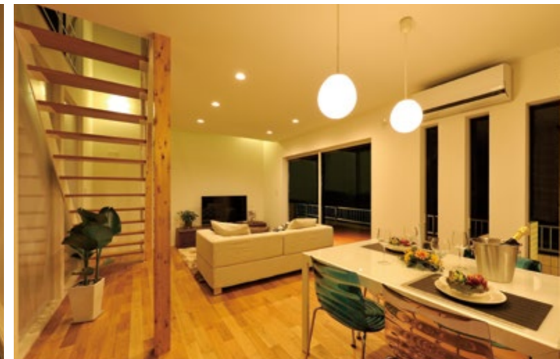
2階の個室へは、リビングルームの階段を上ります。自然と家族が顔を合わせる機会が増えて、コミュニケーションが深まりますね。空間を圧迫しないデザインにも配慮されています