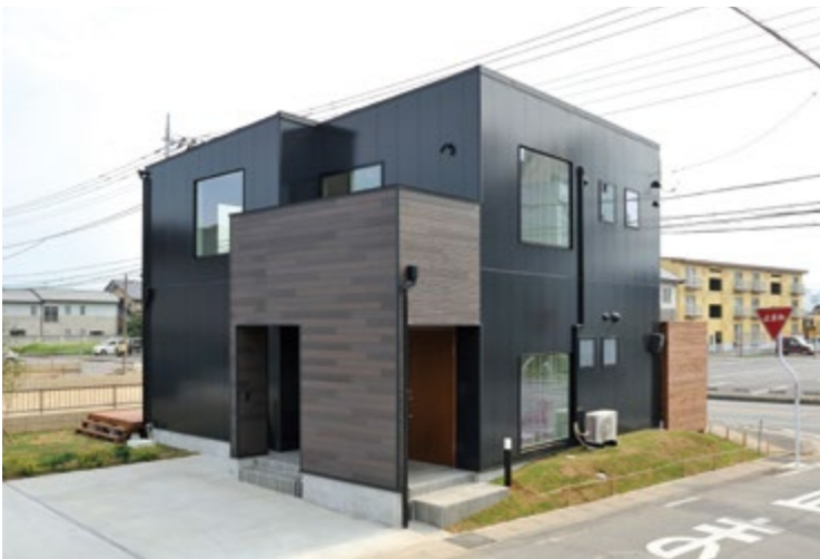
大きな窓からは自然の日差しがたっぷりと降りそそぎます。ブラックのオリジナルサイティングが印象的です