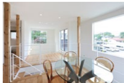
室内は白を基調に、フローリングの床をはじめ、効果的に天然木をレイアウト。階段脇の木の柱がナチュラルなアクセントになっています