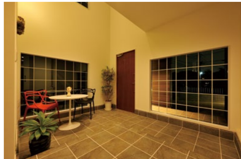
広々とした吹き抜け空間で夜景を眺めながらくつろぎのひとときを演出します