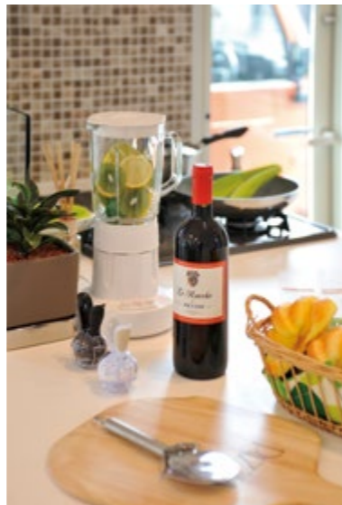
アイランドキッチンのテーブルトップは、お菓子やパン作りにも重宝する十分な広さが確保されています。パーティーなど大勢のお料理を用意する時にも大活躍してくれます