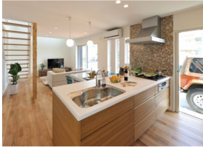
キッチンに立つとリビング全体が見渡せるので、子育て中のママも安心ですね。アイランドタイプのキッチンはワークトップが広いので、お子様と一緒に料理を楽しむ設計です