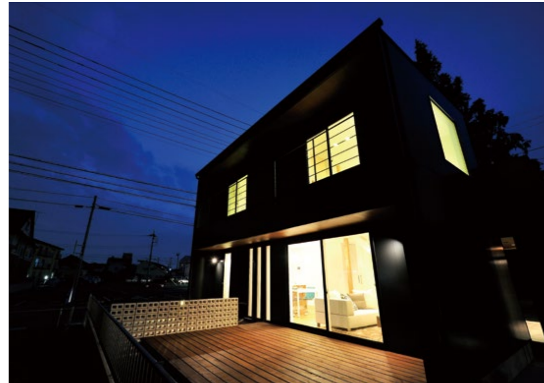
日が沈むと、暖かい光に満ちた室内が美しく浮かび上がります。端正なシルエットがひととき目を引きま

アカギホームの前橋モデルハウスは、延べ床面積約29坪のごく平均的なサイジングでありながら、室内は開放感と光に満ちた広々とした空間が提案されています。これは、目が留まるアイストップを呼ばれるポイントをあえてなくす視覚効果や、採光に配慮した空間設計のなせる技。また、卵の殻を再利用した壁紙、オリジナルの外壁材や水回り、キッチン等、材質やデザインともに、どこにもないオリジナル性に満ちたアイテムが提案されています。 選任のインテリアコーディネーターが手掛けた美しく暮らしやすい空間づくりも、大いに参考になさってくださいね。