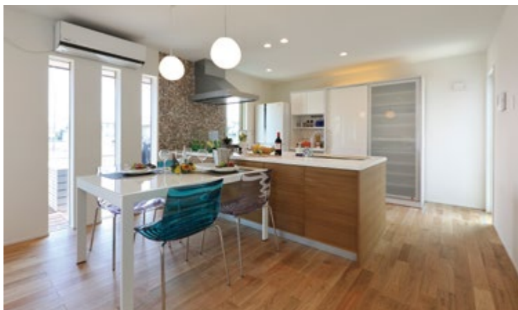
スリット窓は外からの視線をほどよく遮りながら光をたっぷりと通してくれます