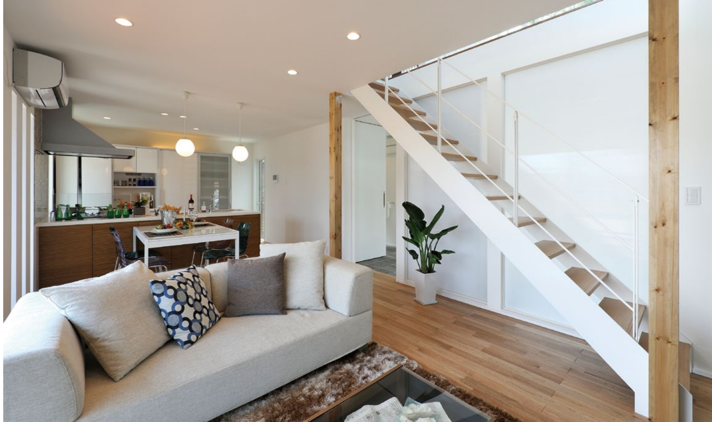
「ホームパーティハウス」をコンセプトにデザイン・設計しました。気のおけない仲間たちや家族が集う、笑顔あふれる日常を望む方にはぴったりのLDKプランです